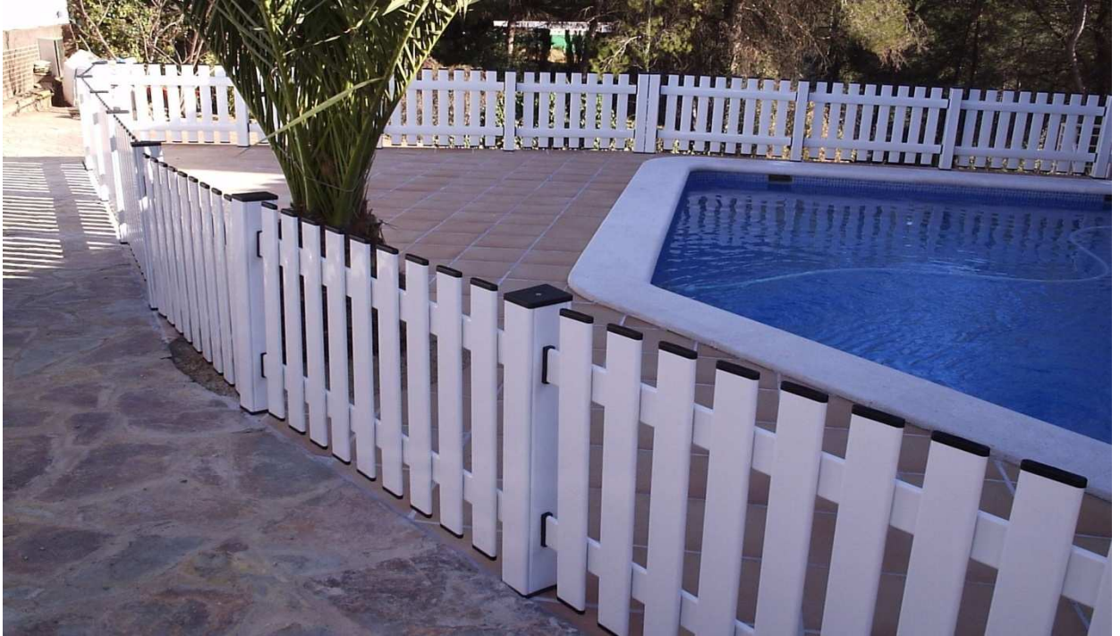
ASPECTO DE LA VALLA TERMINADA